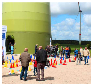
Inbetriebnahme des Windparks Bendorf-Oersdorf

Ein gutes halbes Jahr nach Inkrafttreten des Regionalen Raumordnungsprogramms 2013 für den Landkreis Stade wurde die Genehmigung nach dem Bundes-Immissionsschutzgesetz für unseren Windpark Immenbeck (Hansestadt Buxtehude) erteilt. Dieses Vorhaben umfasst drei Windenergieanlagen des Typs Enercon E-115 mit einer installierten Leistung von jeweils 3,0 MW und einer Gesamthöhe von 193 m. Baubeginn war im September 2015. Da die Standorte der Windenergieanlagen auf archäologisch relevanten Flächen liegen, auf denen bereits entsprechende Fundstellen dokumentiert sind, wurde eine baubegleitende archäologische Untersuchung angeordnet. Gefunden wurden die letzten Reste einer vorgeschichtlichen Siedlung – es handelt sich dabei neben Gruben, Brunnen und Überresten eines Wohnhauses insbesondere um drei 2.000 Jahre alte Brennöfen.