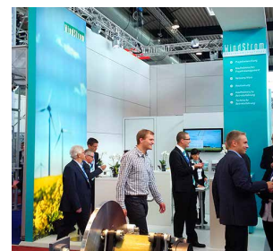
Unser Messestand auf der HUSUM Wind 2015