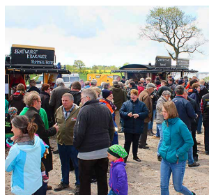
Viele Besucher folgten der Einladung zum Windfest